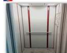
Замена и капитальный ремонт лифтов – 206,3 млн руб.