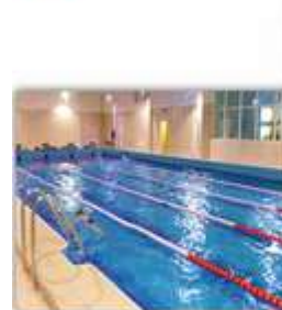
Ремонт объектов Управления по спорту – 94,5 млн руб.

Ремонт объектов Управления по делам культуры и искусства – 10,4 млн руб.