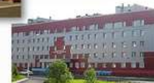
Ремонт объектов Управления социальной политики – 25,9 млн руб.