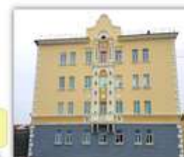
Ремонт и окраска фасадов – 73,0 млн руб.