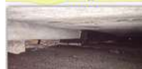
Сохранение устойчивости зданий перспективного жилищного фонда – 185,9 млн руб.