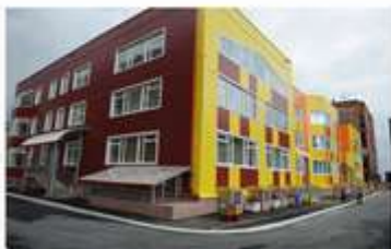
Реконструкция здания Детского сада № 69 – 45,5 млн руб.

Ремонт объектов Управления общего и дошкольного образования – 122,6 млн руб.