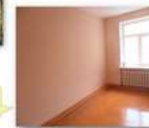
Ремонт муниципальных квартир – 47,6 млн руб.